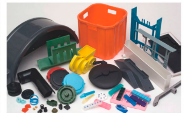
Productos de plástico