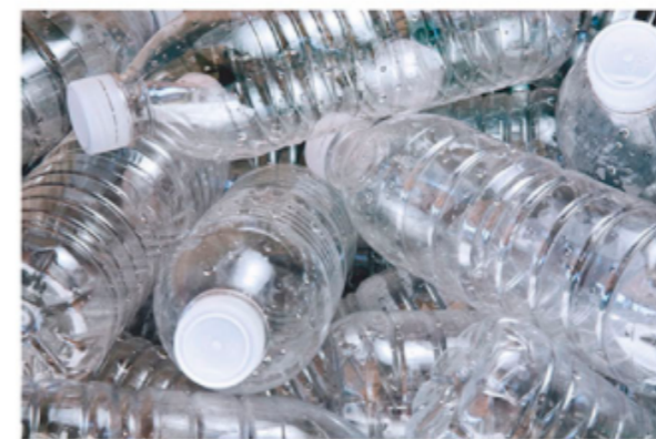
Botella de plástico